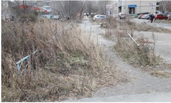
До выполнения работ