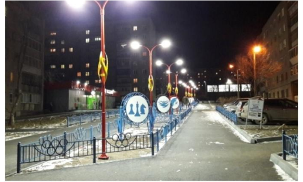
После выполнения работ