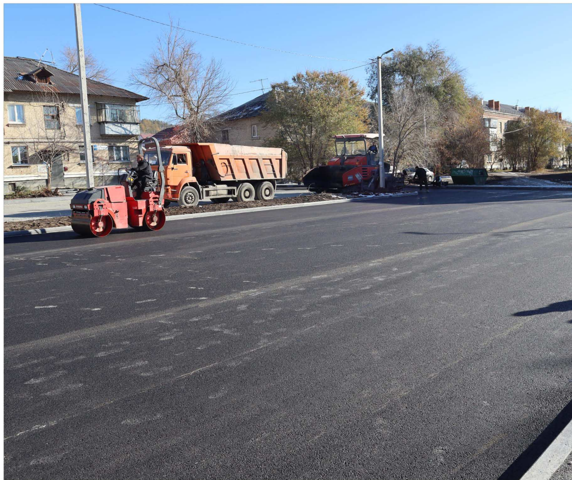
Парковку возле школы № 44 давно ждали учителя, родители и местные жители. К обустройству территории подрядчик подошел комплексно: оборудованы тротуар, ливневка и место для мусорных баков. Новая парковка в дни массовых мероприятий разгрузит площадку на Ильменской.

— В первом нашем созыве депутатам на исполнение наказов избирателей выделялось всего 500 тысяч рублей. И я пытался их как-то распределить — везде понемногу. А потом понял, что лучше всего сразу делать большой проект.