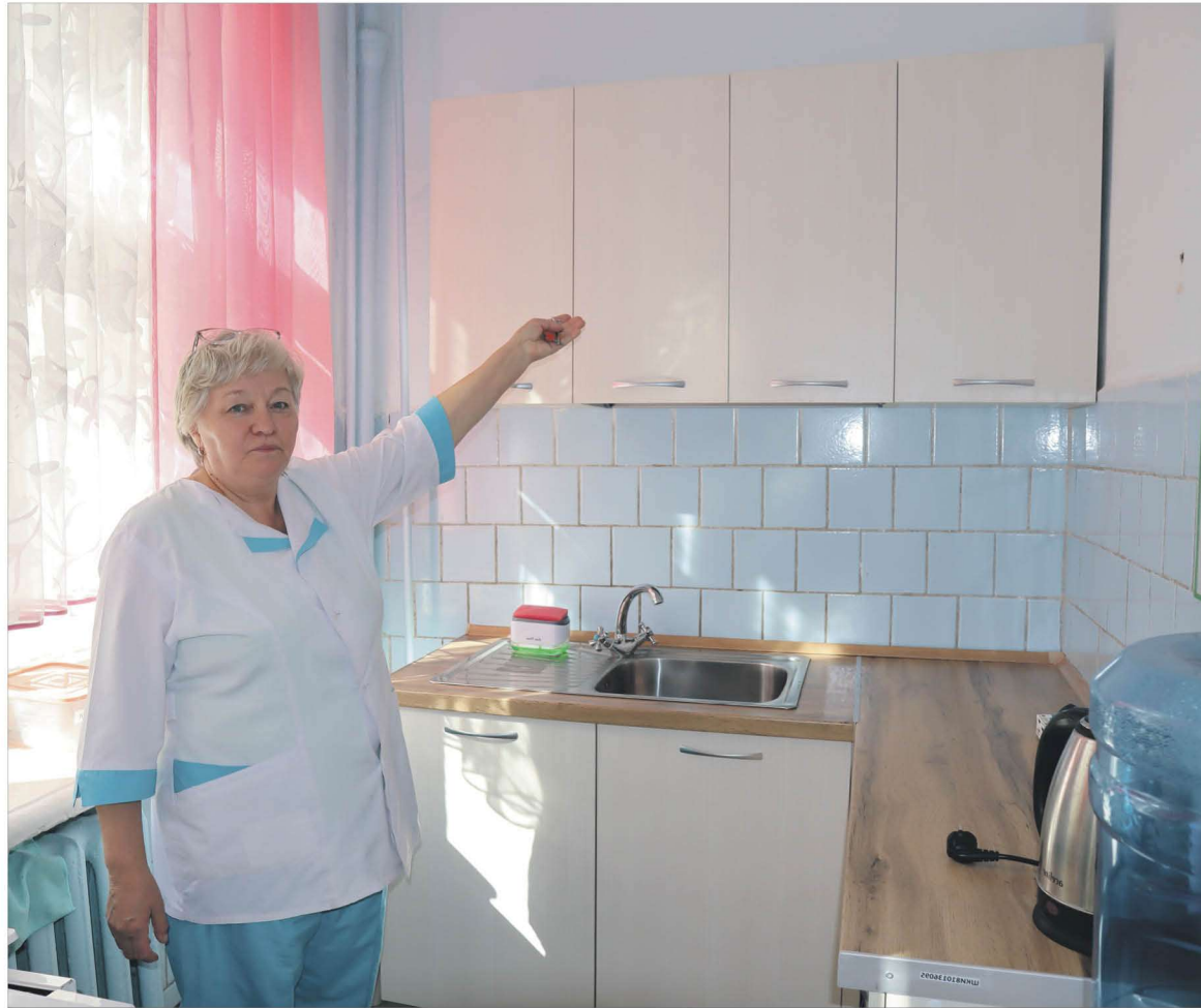
В этом году благодаря помощи депутата в специальной коррекционной школе-интернате VIII вида появилась мебель, сделанная на заказ, — в частности, кухонные гарнитуры.

Новый тротуар получился протяженным и добротным.