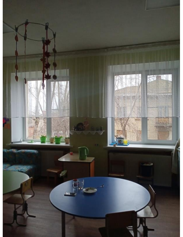
Замена окон в МБДОУ № 87